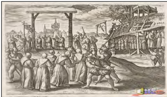
نه‌شکه‌نچه و نازاردان له سه‌ده‌کانی ناو‌دراستدا