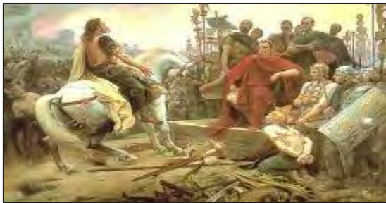
ده‌ره‌به‌گایه‌تی له نه‌ورپا